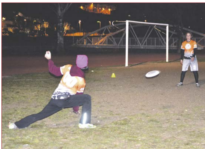
Dos jugadores practicando lanzamientos

vienen cuatro equipos de Madrid y uno de A Coruña. Solemos hacer las jornadas en Villaruela, por problemas de disponibilidad, pero la última vez que nos juntamos pudimos alquilar los campos de la Aldehuela e hicimos una jornada ahí”, explica el entrenador.