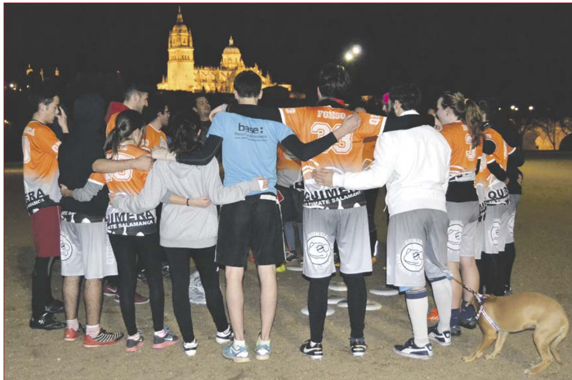
Los jugadores forman una piña antes de entrenar