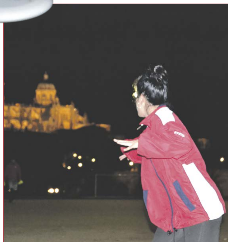
Las mujeres son una pieza clave en el equipo

Una de las marcas más características del deporte son los valores de solidaridad e igualdad que transmite. Los jugadores son educados para respetar las reglas y las aceptan desde el inicio. "Si no las aceptas eres mal visto dentro de este deporte", comenta Roberto Arroyo, entrenador del