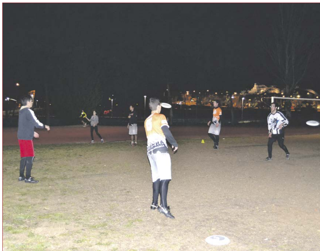
Así entrenan los jugadores de Ultimate Frisbee en Salamanca